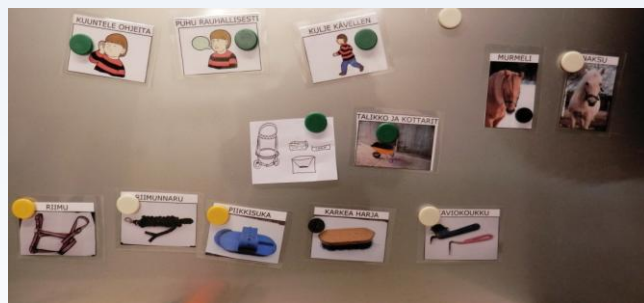
Hevostoimintakäynnin tapahtumia jäsennettiin toiminnanohjaukskorttien avulla.

Lasten (n = 5) keskittymis- ja tarkkaavuusvaikeuden oireiden ilmeneminen huoltajien arvioimana ennen hevostoimintakäyntejä ja niiden jälkeen (ADHD-oireiden kartoituslomake).