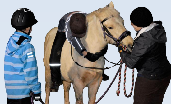
Hevosen selässä voi tehdä tasapainoharjoituksia. Samalla lapsi kokee hevosen lämmön ja läheisyyden.